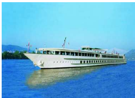
Paquebot fluvial

En regard de l'augmentation des places offertes et de la commercialisation des produits « croisière fluviale » sur plusieurs canaux de distribution à des prix compétitifs, en 2010, le secteur enregistre 196 900 passagers transportés (+21 % par rapport à 2009 en 2010). Les compagnies de paquebots fluviaux enregistrent une fréquentation croissante depuis plusieurs années pour ce type de croisières qui se démocratisent.