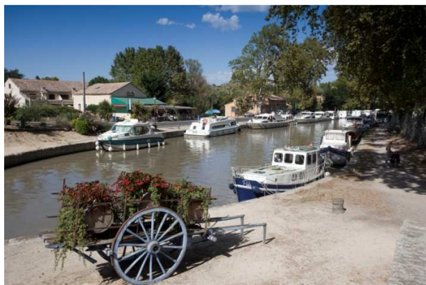
Canal du Midi, Capestang

Les résultats de l'enquête au titre de 2010 indiquent un fléchissement de l'activité. Le nombre total de contrats est estimé à 29 710 soit une baisse de 6 % par rapport à 2009. En effet, une société de location basée dans le Sud, a cessé son activité, impactant les résultats de l'activité de la location. Néanmoins, la flotte de cette société a été rachetée et navigue de nouveau en 2011.