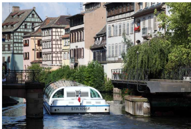
Canal de Strasbourg

Les bateaux promenade ont transporté 9,3 millions de passagers en 2010. La région Ile-de-France reste incontestablement la plus dynamique puisqu'elle transporte presque la majorité des passagers soit 6,6 millions en 2010. En province, les résultats sont plus hétérogènes du fait du comportement spécifique des différentes sociétés qui s'y trouvent. Le Languedoc-Roussillon est plus attractif en termes de passagers transportés.